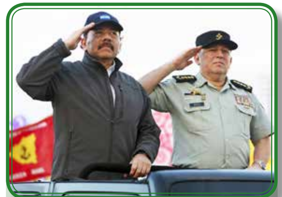
Desfile Militar "Pueblo Ejército".