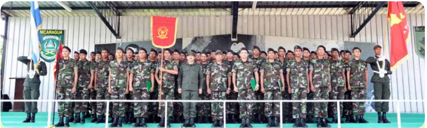
Bloque vanguardia, Brigada de Infantería Mecanizada “General Augusto C. Sandino”.

El bloque vanguardia, Brigada de Infantería Mecanizada “General Augusto C. Sandino”; bloque destacado, Fuerza Aérea, además recibió distinción un bloque de Damas y Caballeros Cadetes del Centro Superior de Estudios Militares “General de División José Dolores Estrada Vado”.