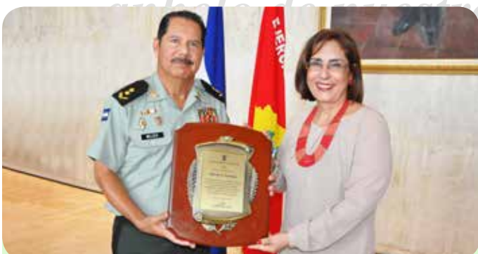
Ministra de Gobernación de la República de Nicaragua, máster Ana Isabel Morales Mazún.

“...haremos todo para asegurar el mayor bienestar de nuestro pueblo.”