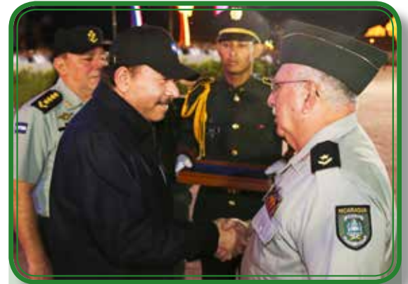
Ascensos en grados militares.