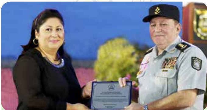
Ministra de Defensa de la República de Nicaragua, doctora Martha Elena Ruiz Sevilla.