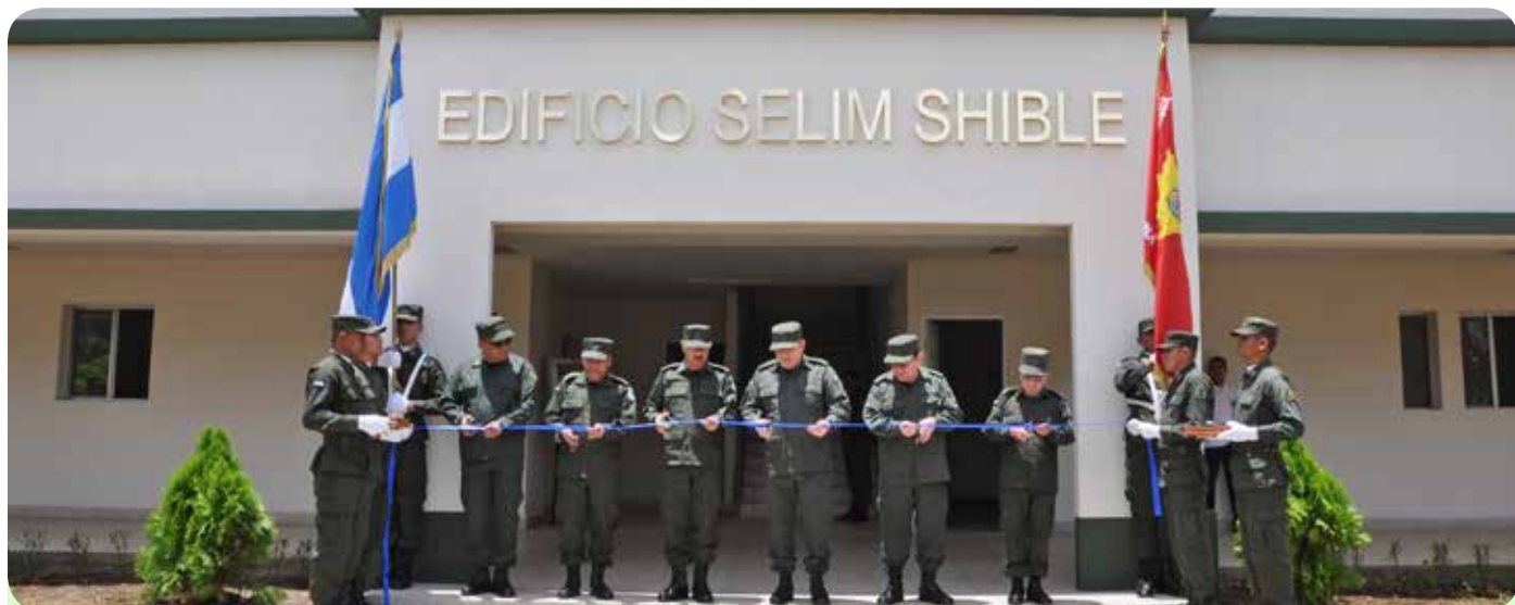
Edificio Selim Shible.