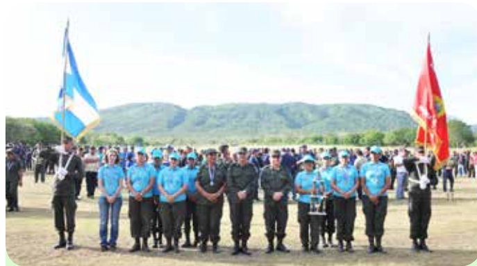
Equipo femenino, segundo lugar en la modalidad de fusil AKM.