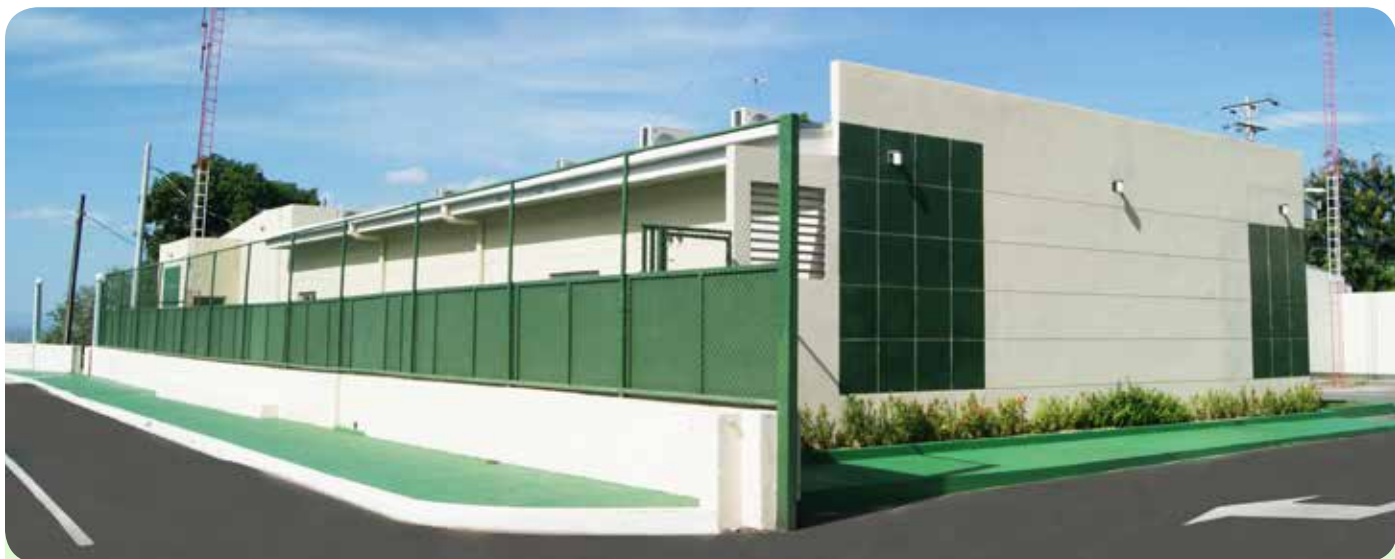
Centro de Comunicaciones Fijo del Estado Mayor General.