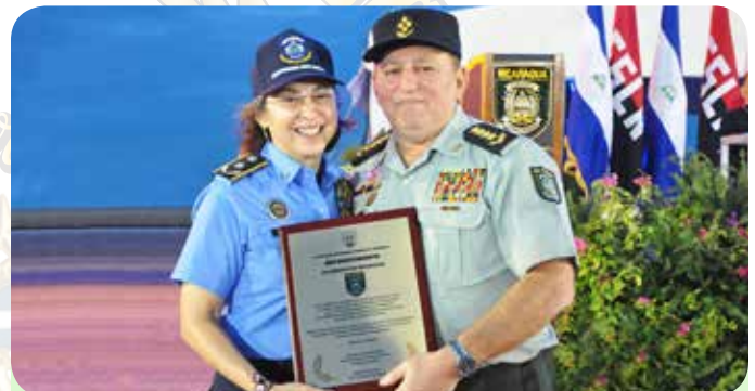
Directora General de la Policía Nacional, Primera Comisionada Aminta Elena Granera Sacasa.