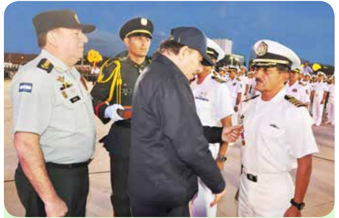
Jefe del Estado Mayor de la Fuerza Naval de la República de Honduras, Capitán de Navío Carlos Enrique Ochoa Turcios.