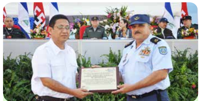
Director General del Instituto Nacional de Aeronáutica Civil, Capitán Carlos Salazar Sánchez.