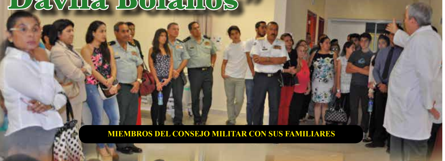
MIEMBROS DEL CONSEJO MILITAR CON SUS FAMILIARES