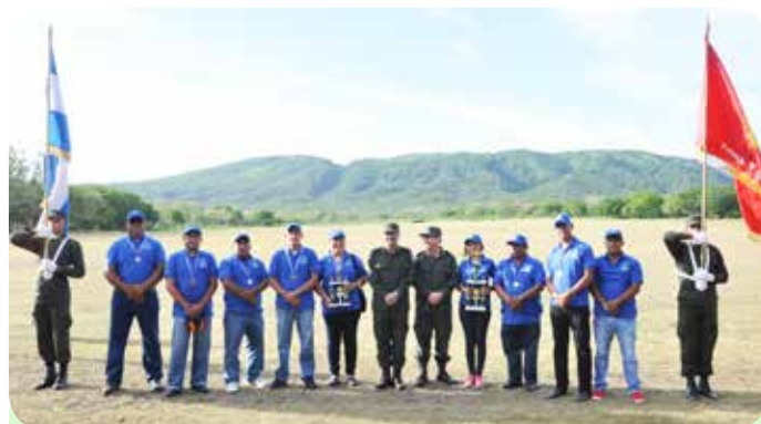
Equipo del Ministerio de Defensa, primer lugar en la modalidad de fusil AKM.