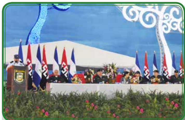
36 aniversario de constitución de la Fuerza Aérea.