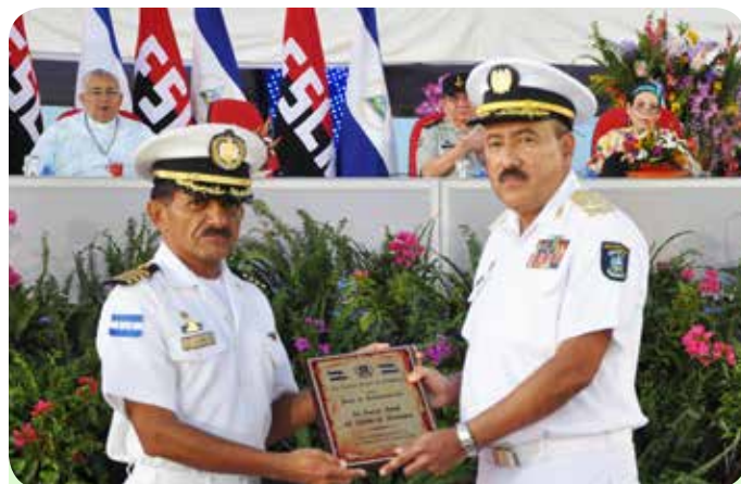
Jefe del Estado Mayor de la Fuerza Naval de la República de Honduras, Capitán de Navío Carlos Enrique Ochoa Turcios.