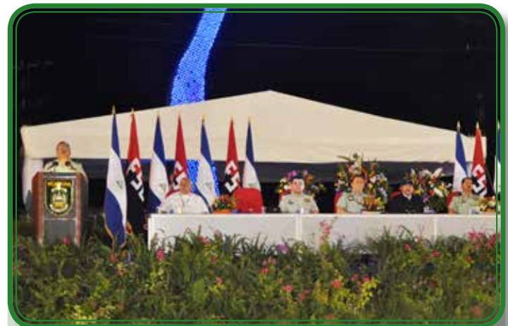
36 aniversario de constitución del Cuerpo Médico Militar.