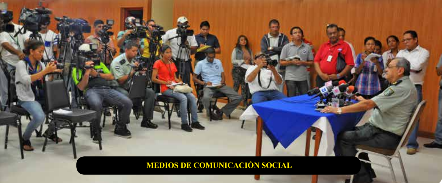
MEDIOS DE COMUNICACIÓN SOCIAL