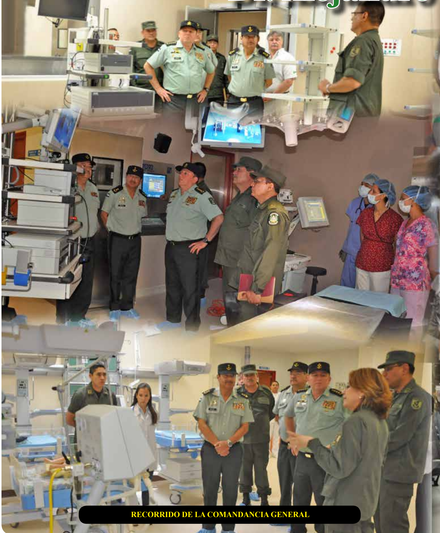
RECORRIDO DE LA COMANDANCIA GENERAL