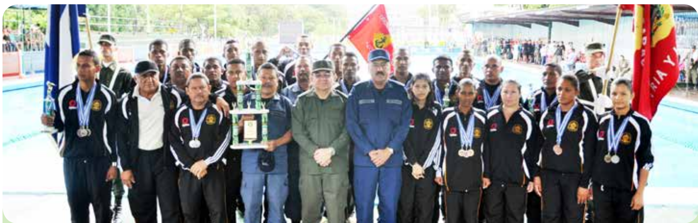
Primer lugar, Fuerza Naval.

En el acto de clausura participaron generales de brigada y oficiales superiores miembros del Consejo Militar, equipos de natación, personal de las unidades militares, familiares de los atletas e invitados especiales.