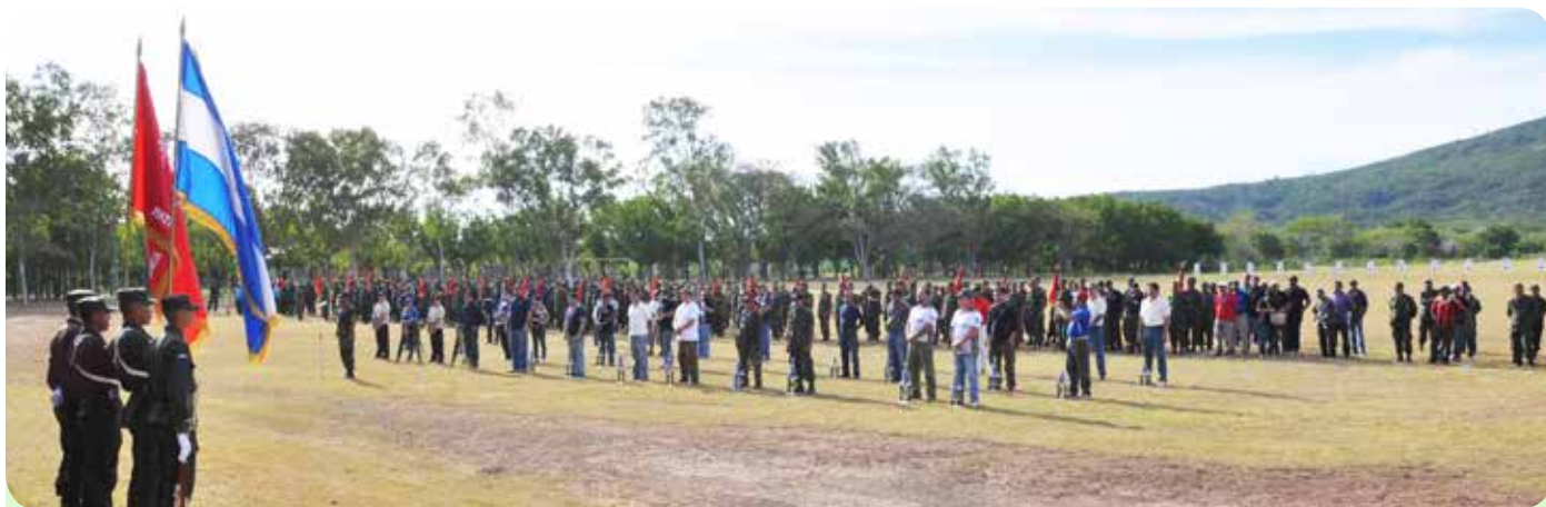
Equipos y tiradores participantes en el XXXI Campeonato Nacional de Tiro "Capitán Carlos Marvin Osorio Lupone in Memoriam".