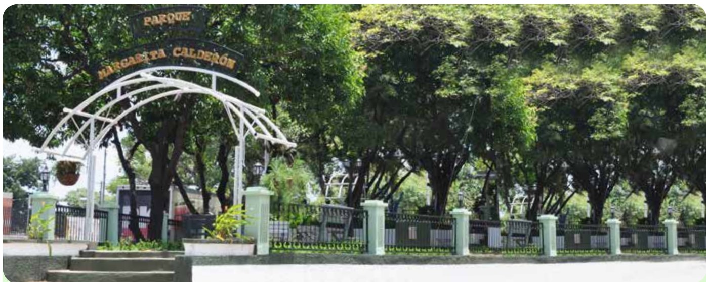
Parque Margarita Calderón.