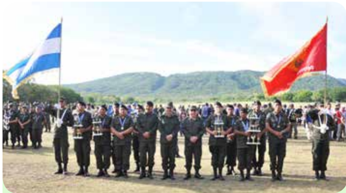
Equipo del Cuerpo de Escoltas "Soldado Calixto Tercero González", primer lugar en la modalidad con armas de apoyo.