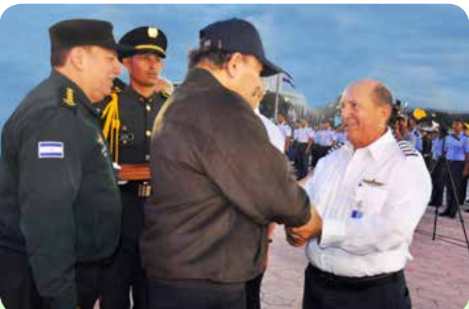
Mayor Eduardo Antonio Hurtado Lazo, en la honrosa condición de retiro.