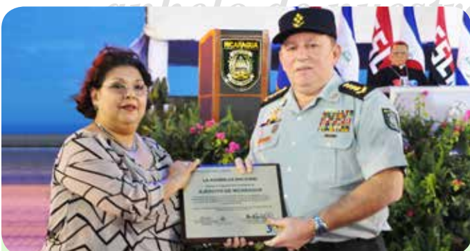
Presidenta de la Asamblea Nacional por la ley, licenciada Iris Montenegro Blandón.

...haremos todo para asegurar el mayor bienestar de nuestro pueblo. ¿Verdad?