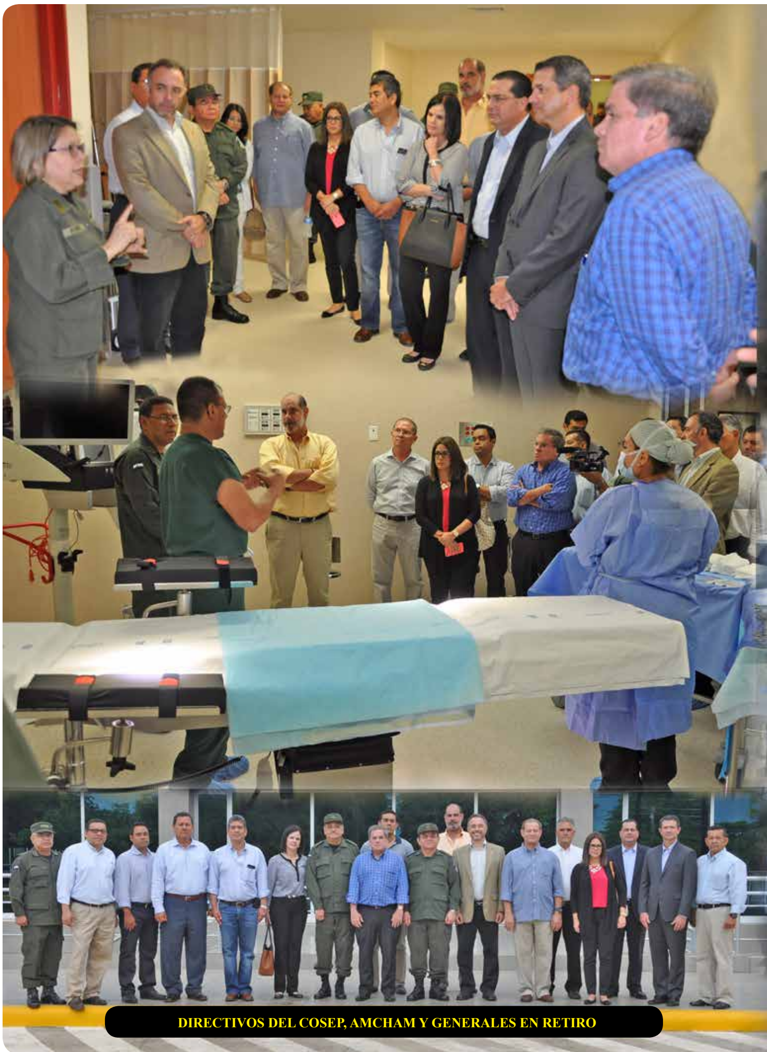
DIRECTIVOS DEL COSEP, AMCHAM Y GENERALES EN RETIRO