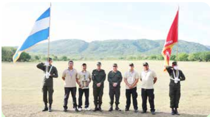
Equipo de la Vicepresidencia de la República, primer lugar modalidad pistola.