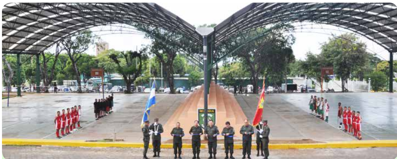
Cancha Deportiva Multiuso.