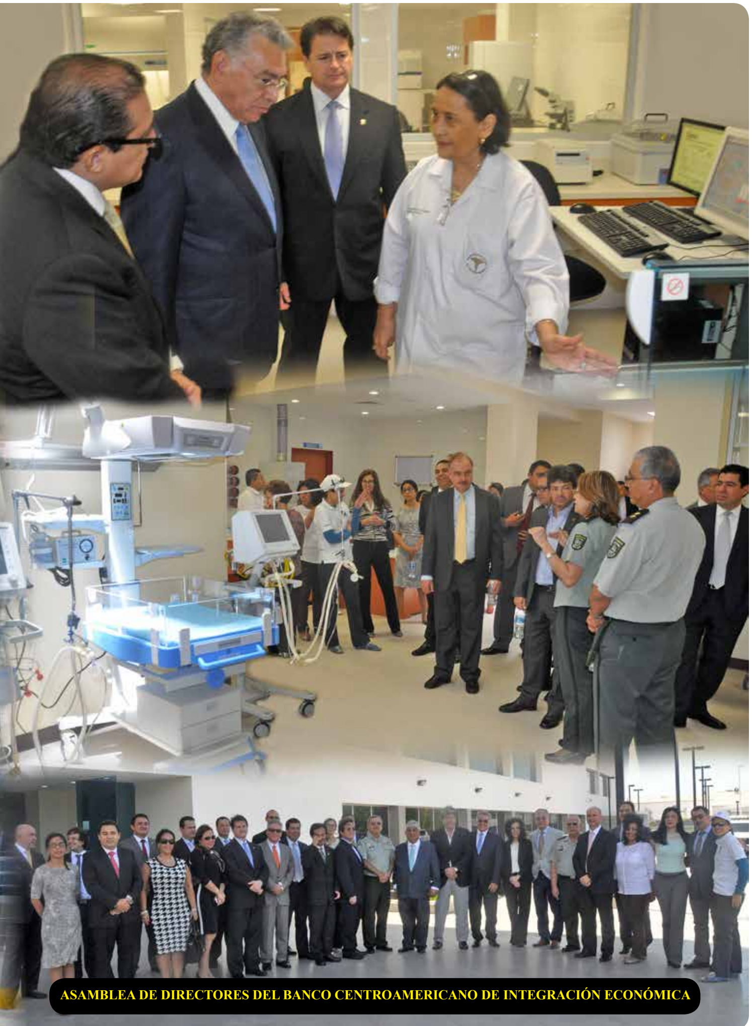
ASAMBLEA DE DIRECTORES DEL BANCO CENTROAMERICANO DE INTEGRACIÓN ECONÓMICA