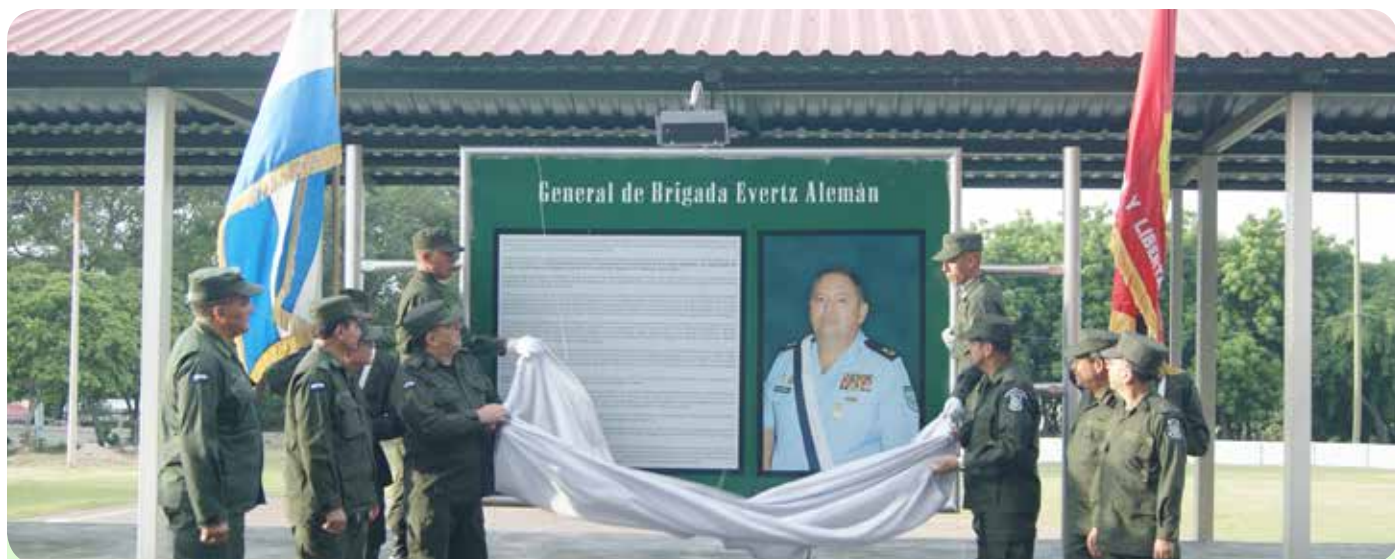
Campo de Béisbol "General de Brigada Evertz Alemán".