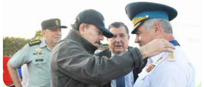
Presidente de la República impone condecoración al Coronel General Viktor Nikolaevich Bondarev.

El Presidente de la República y Jefe Supremo del Ejército de Nicaragua, Comandante Daniel Ortega Saavedra, durante el acto impuso la condecoración “Gran Cruz Ejército de Nicaragua” General de Brigada EDSNN Juan Pablo Umazor al Jefe de las Fuerzas Aeroespaciales de las Fuerzas Armadas de la Federación de Rusia.