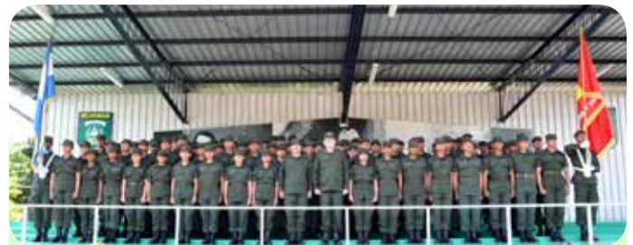
Bloque con distinción, Centro Superior de Estudios Militares “General de División José Dolores Estrada Vado”.