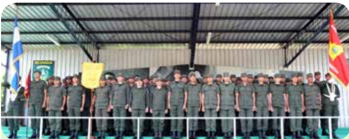
Bloque destacado, Fuerza Aérea.