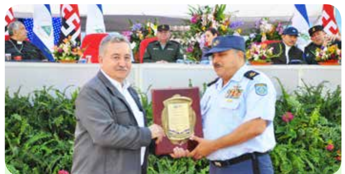
Presidente del Consejo Nacional de Universidades, ingeniero Telémaco Talavera.