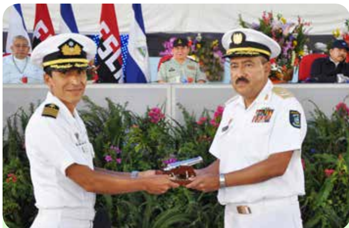
Jefe del Estado Mayor General de la Fuerza Naval de la República de El Salvador, Capitán de Navío René Francis Merino Monroy.