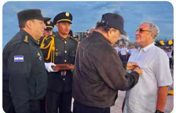
Mayor Samuel Granera Miranda, en la honrosa condición de retiro.