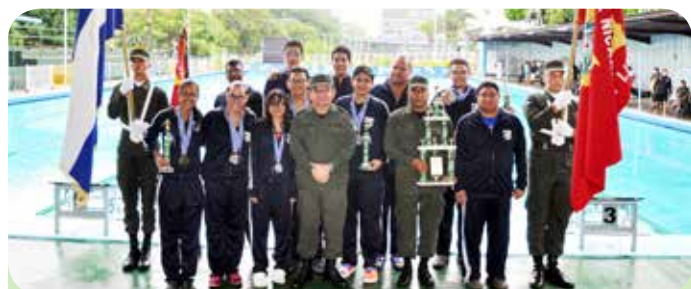
Tercer lugar, Cuerpo Médico Militar.