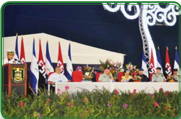
35 aniversario de constitución de la Fuerza Naval.