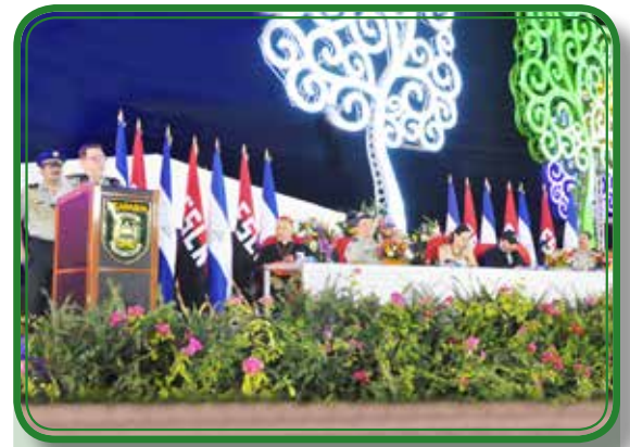
36 aniversario de constitución del Ejército de Nicaragua.