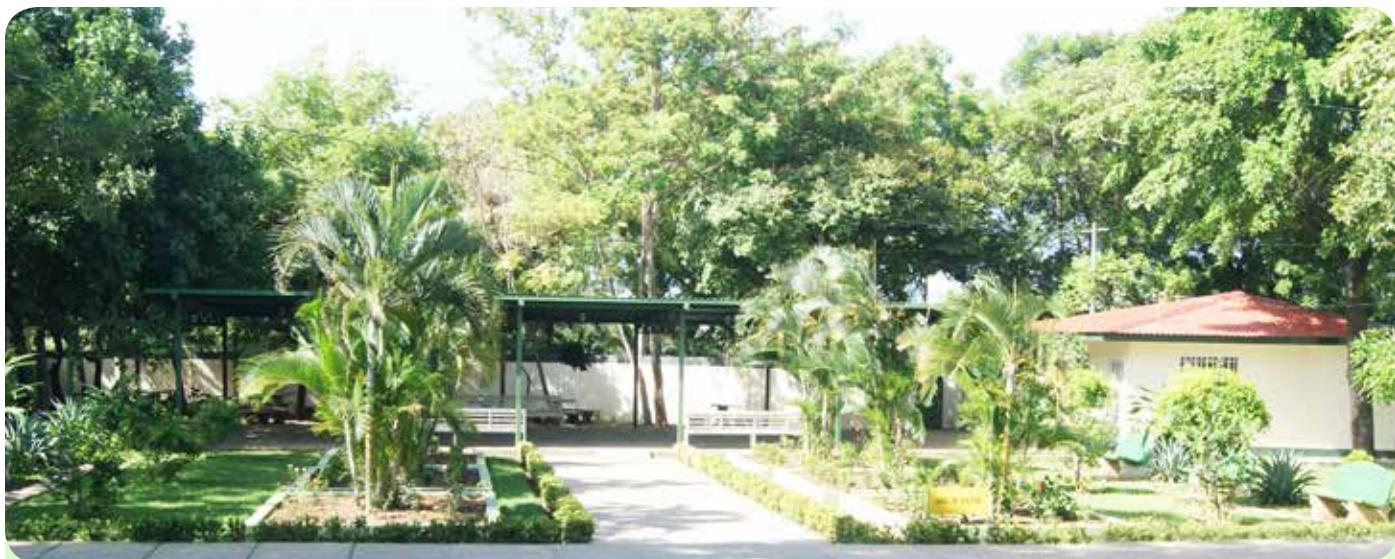
Área de visita y comisariato del Regimiento de Comandancia.