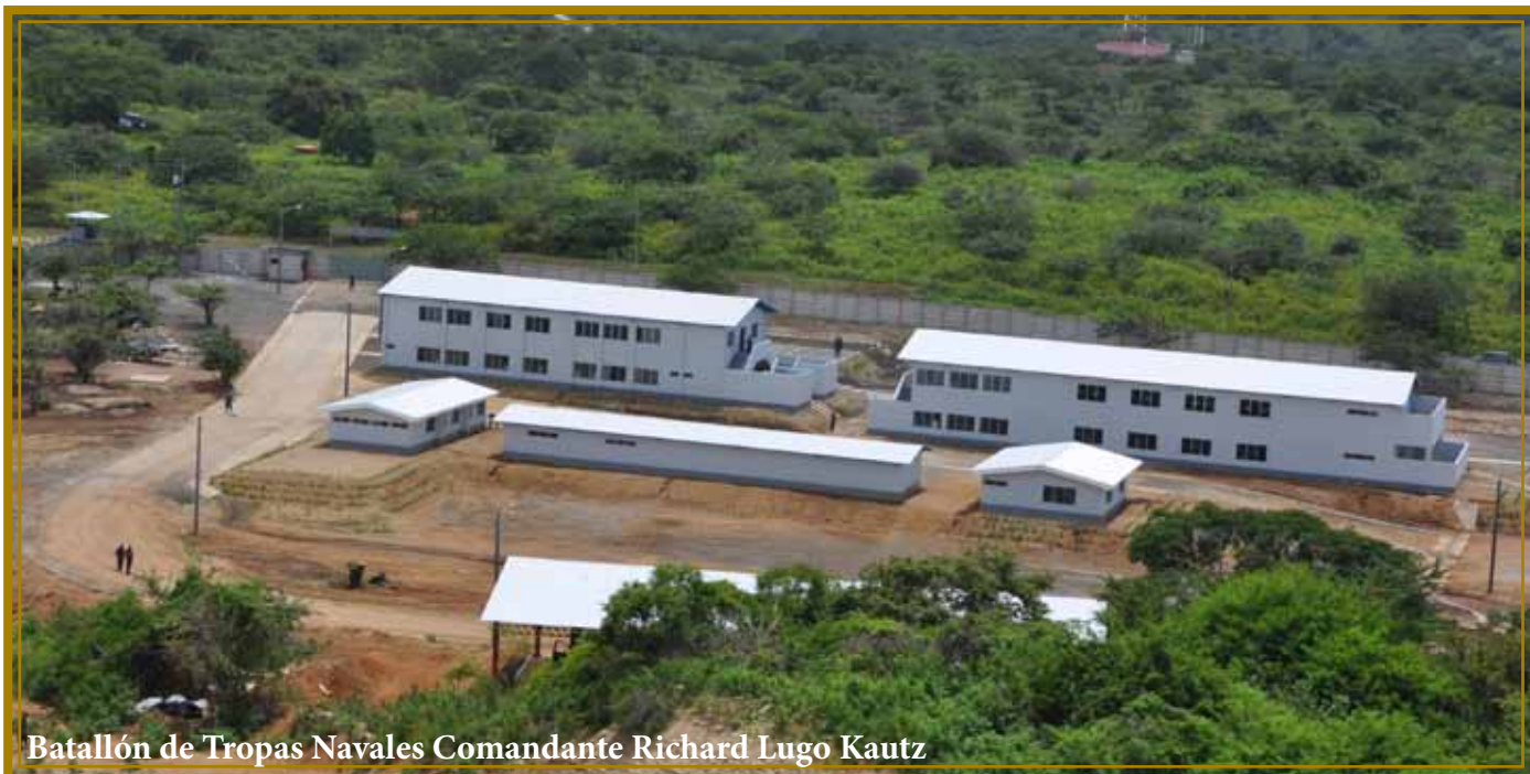
Batallón de Tropas Navales Comandante Richard Lugo Kautz

Desplegamos el primer Hospital de Campaña Doctor Óscar Danilo Rosales Argüello de los seis recibidos, para conocimiento de nuestro pueblo, autoridades y estudiantes de la Facultad de Medicina. Abanderamos el primer Módulo de Máquinas Ingenieras Gerónimo Adrián Rivas López, con la cooperación del Ministerio de Emergencias de Rusia y EMERCON, lo que nos permite iniciar la reconversión del Cuerpo de Ingenieros, y fortalecer las capacidades de reparación de caminos secundarios.