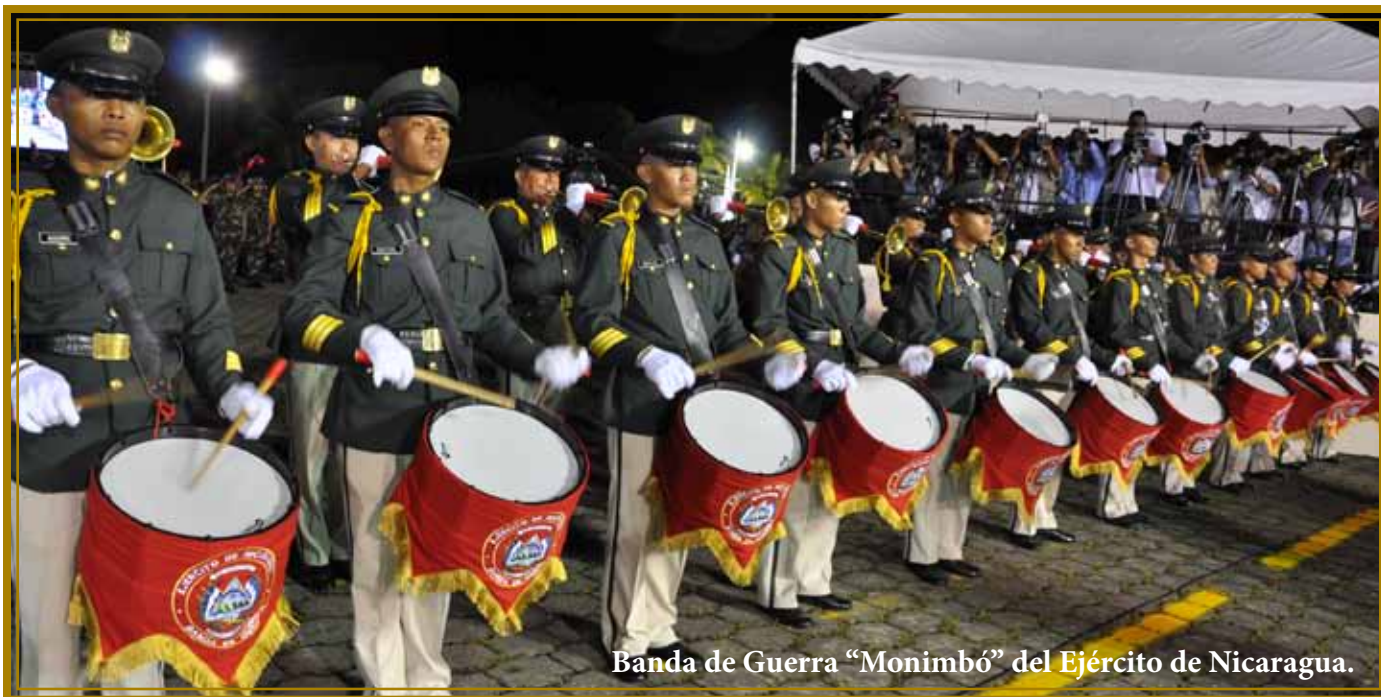
Banda de Guerra “Monimbó” del Ejército de Nicaragua.

Nuestro agradecimiento a los oficiales en condición de retiro; ustedes aportaron a la construcción de esta institución. Agradecemos a nuestros familiares por el decidido apoyo para que podamos cumplirle a la Patria. Nuestro agradecimiento infinito al pueblo de Nicaragua por la confianza que depositan en nosotros. Ante ustedes nos comprometemos a seguir trabajando día a día como hermanos, para construir la Patria que soñamos.