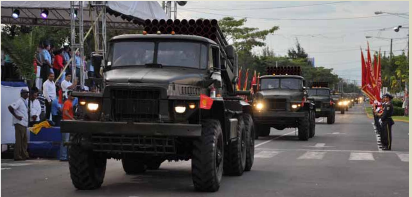
Bloques representativos de las distintas unidades militares que participaron en el desfile militar en honor al pueblo de Nicaragua.