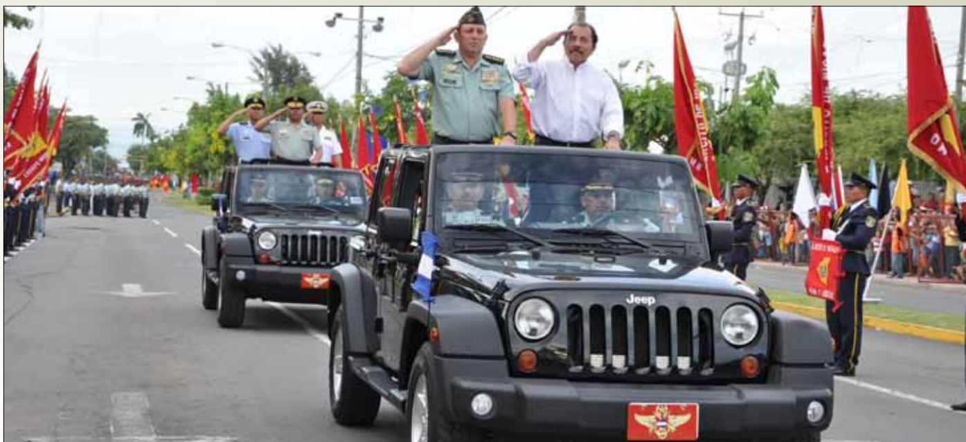
Bloques representativos de las distintas unidades militares que participaron en el desfile militar en honor al pueblo de Nicaragua.